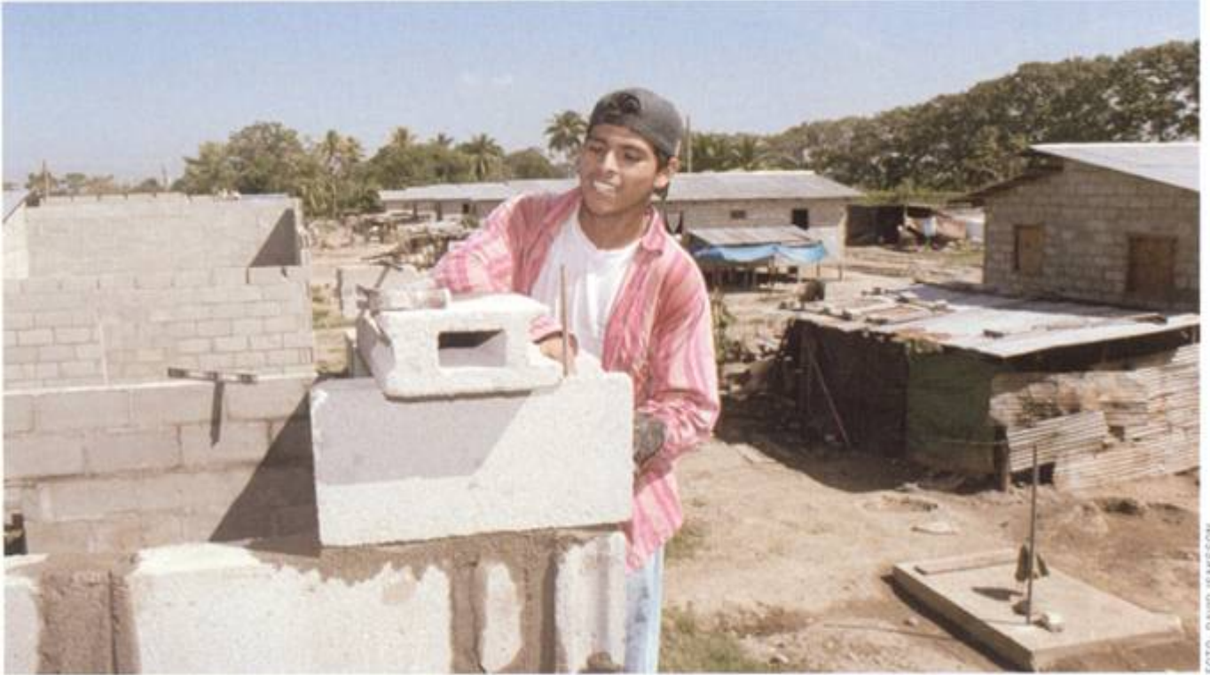
Ladrillo por ladrillo. Suecia es uno de los pocos países donantes que está apoyando a Honduras en la construcción de una nueva gobernabilidad.

para la descentralización, desarrollo local y fortalecimiento municipal (PRODEL).