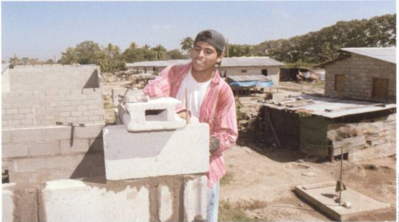
Ladrillo por ladrillo. Suecia es uno de los pocos países donantes que está apoyando a Honduras en la construcción de una nueva gobernabilidad.

para la descentralización, desarrollo local y fortalecimiento municipal (PRODEL).