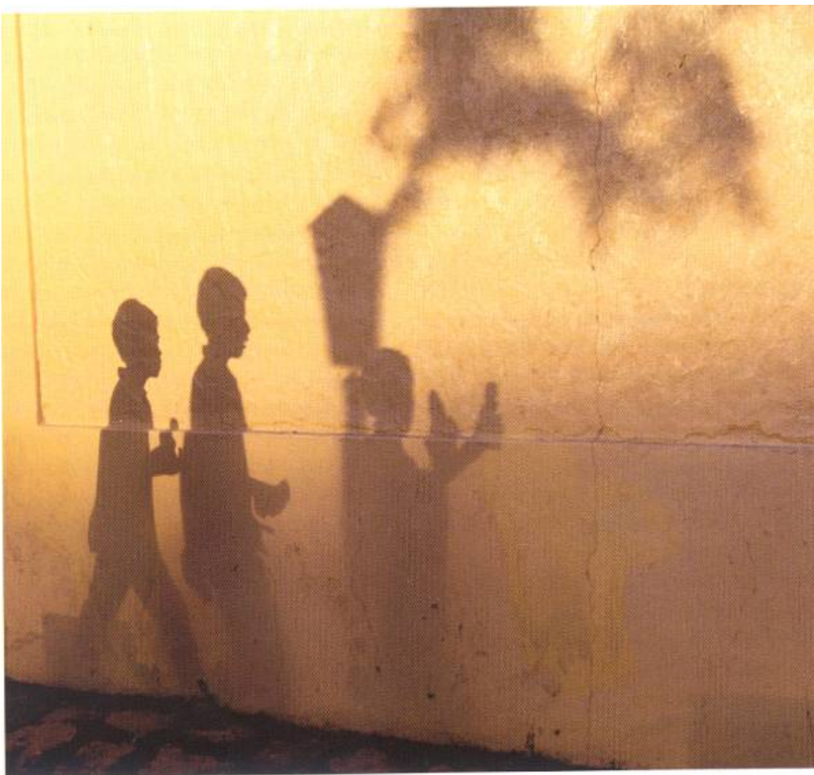
La distribución de ingresos y de la propiedad es muy inequitativa en Honduras

La distribución de ingresos y de la propiedad es muy inequitativa en Honduras. Los sistemas de impuestos y transferencias actuales no mejoran esta distribución sino más bien la agravan. Se podría reducir una gran parte de la pobreza si el país tuviese sistemas más equitativos de impuestos y transferencias.