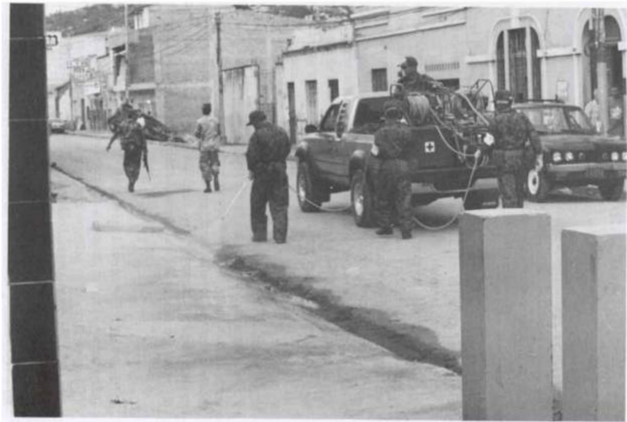
Fumigación realizada por la Guardia Real Médica del Imperio del Japón