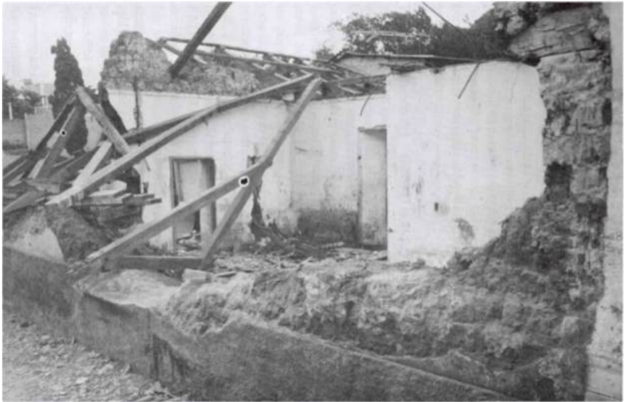
Destrozos en la 1ra Ave. De Comayagüela, hoy Avenida de México lo que quedó una vez bajadas las aguas torrenciales.

Según expertos, Honduras retrocedió 30 años, agravando sus ancestrales problemas de desocupación (53%) y los niveles de pobreza que superaban el 50% de los 5,8 millones de hondureños.