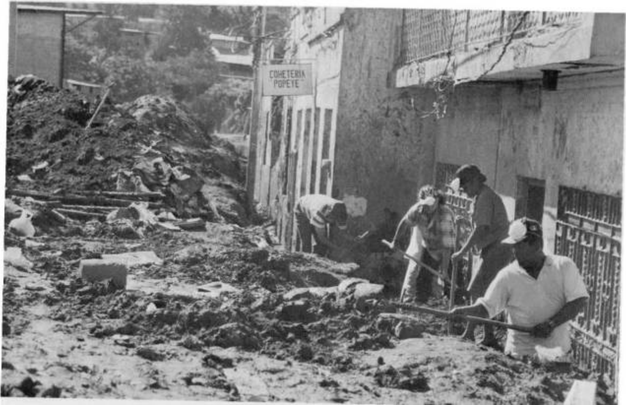
Posterior a la tormenta Huracán Mitch, las corrientes del Río Chiquito, afluente del Río Choluteca, así dejaron los Edificios y las Calles del Barrio la Hoya de Tegucigalpa.