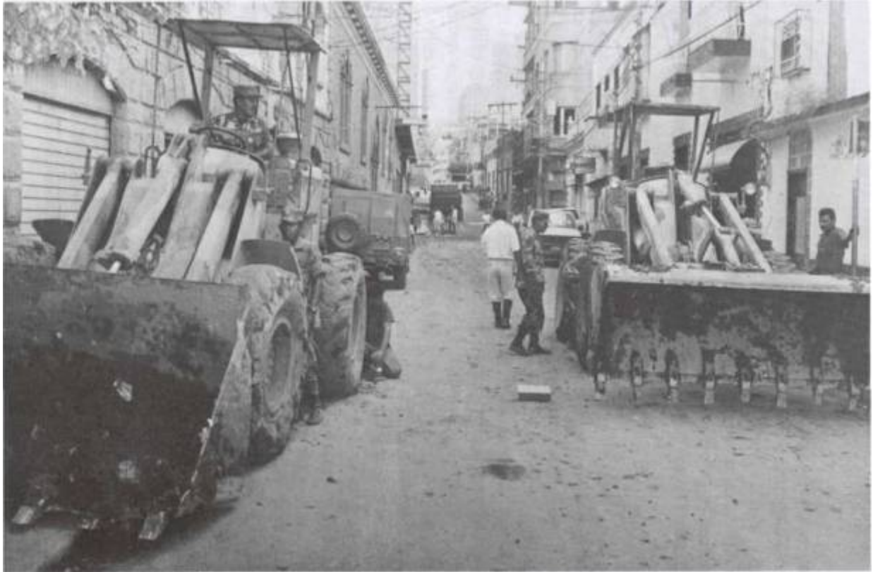
Abnegado y loable labor que desempeñaron los soldados del Batallón de Ingenieros, de la República hermana de México.