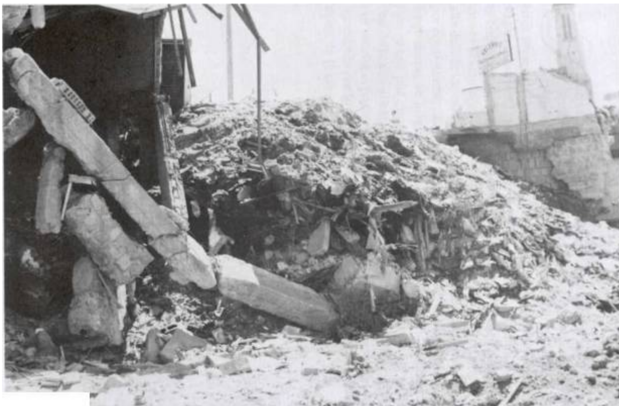
Destrozos en la 1* Ave. De Comayagüela, hoy Avenida de México lo que quedó una vez, bajadas las aguas torrenciales.