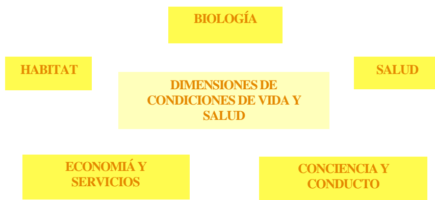
Figura 1 – Dimensiones de las Condiciones de Vida y Salud

Este paradigma trata de entender la calidad y propiedades de las diferentes partes en una complejidad sistémica donde cada dimensión tiene un efecto de resonancia que no es necesariamente armónico. La propuesta no pretende determinar un modelo matemático, su alcance en este trabajo es el de visibilizar cómo la violencia intrafamiliar se construye y afecta las condiciones de vida de las personas.