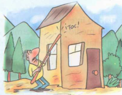
Afectación a las viviendas y personas