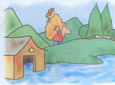
Reflujo de aguas negras. Interrupción de la normalidad cotidiana.