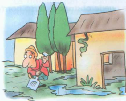
Estancamiento de aguas y proliferación de epidemias y roedores.