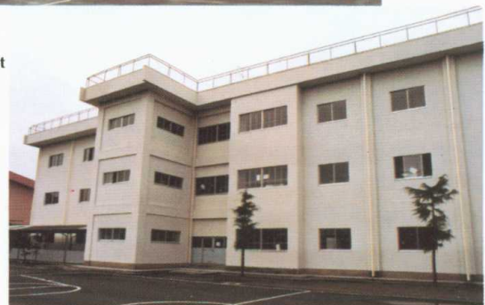
補強後 After improvement