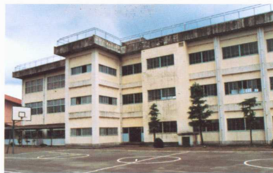
補強前 Before improvement

The earthquake-proof standards for roads, railway lines and lifeline facilities have been reviewed and upgraded wherever necessary. At the same time, work is rapidly being done to renovate and strengthen key facilities.