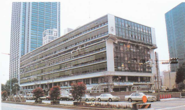
阪神・淡路大震災における神戸市庁舎の被害 (新耐震基準で作られた奥の高層ビルは被害を免れている) Damage to the offices of Kobe City caused by the Great Hanshin-Awaji Earthquake (Built according to the new standards, the high-rise behind was left unscathed)

道路、鉄道、ライフライン施設等においても、施設の耐震基準の再検討がなされ、必要に応じて基準の見直しが進められるとともに、重要な施設から改築や耐震補強等が精力的に進められてきています。