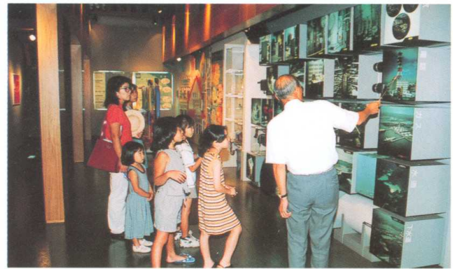
平常時の利用（東京都目黒区防災センター） Utilization during normal times (Disaster Prevention Center in Tokyo's Meguro Ward)