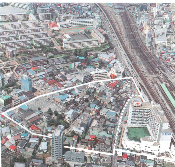
再開発前（赤羽） before redevelopment (Akabane)

Therefore, not only must the various individual facilities but the urban infrastructure itself must be made more earthquake resistant. This is currently being carried out by the government ministries and agencies, prefectural governments and related administrative organs who are instituting countermeasures based on the Basic, Operational and Local Plans for Disaster Prevention. These measures include promoting fire resistance by introducing regulations for construction of wooden structures and providing subsidies for construction of more flame-proof buildings, while maintaining and securing key urban functions by making redundancy into the transportation, power and gas systems into networks.