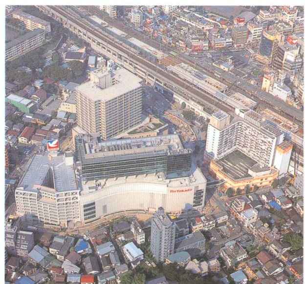
再開発後（赤羽） after redevelopment (Akabane)