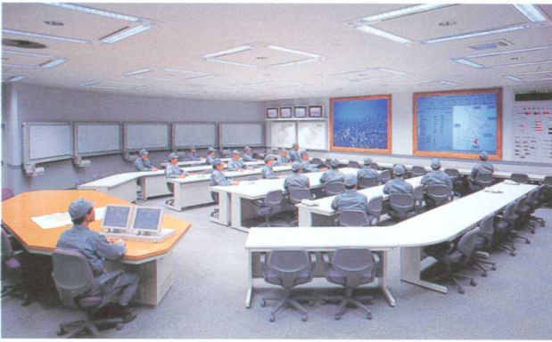
災害対策本部（東京都目黒区防災センター） Headquarter Room for Disaster Countermeasures (Disaster Prevention Center in Tokyo's Meguro Ward)