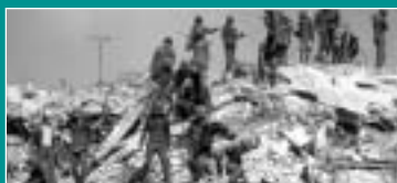
Ciudad de México

Ahora, 20 años después, el gobierno de México en coordinación con la Organización Panamericana de la Salud está organizando una reunión internacional de alto nivel para marcar este aniversario y sacar a relucir el tema de hospitales seguros como una meta de la reducción de los desastres en las Américas. La reunión se celebrará en la Ciudad de México del 19 al 21 de setiembre, y está abierta a profesionales de preparativos en salud, personal de defensa civil y protección civil, ingenieros, arquitectos y otros expertos en mitigación, representantes de ministerios de salud y otras instituciones de América Latina y el Caribe. Todas las sesiones plenarias contarán con traducción simultánea en español e inglés. Marque su calendario; publicaremos más información en la próxima edición de este boletín.