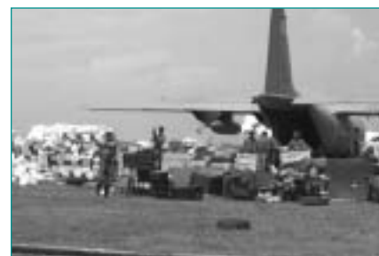
El equipo SUMA ayudó a las autoridades en la identificación de suministros que llegaron a raíz del terremoto y tsunami.

Semanas después de la devastación causada por el terremoto y tsunami en Indonesia en diciembre pasado, llegó a este país una gran cantidad de ayuda internacional. A pedido de la OMS, un equipo de SUMA apoyó al Ministerio de Salud en la clasificación de los suministros que se estaban amontonando en los almacenes.